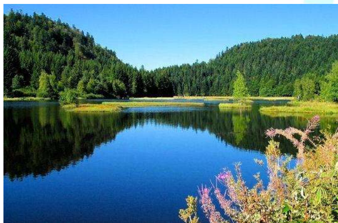
Lac de Lispach

Vous l'aurez compris, tout est fait au PONT DU METTY pour profiter des échecs dans un cadre incroyable. Vous pourrez profiter du décor automnal, mais surtout de tous les équipements au sein du site, comme le babyfoot, le flipper, l'accès au bar et même une piscine.